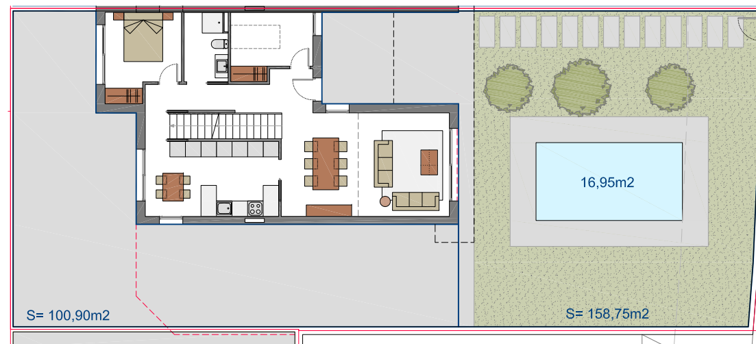
SUPERFÍCIE PARCEL·LA = 359,83 m 2 ESCALA 1/200