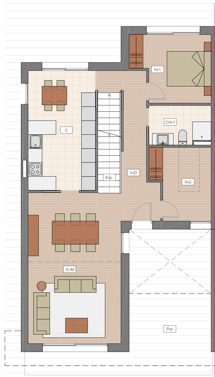
PLANTA BAIXA ESCALA 1/100